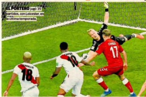
EL PORTERO jugó 35 minutos en los últimos partidos, con Leicester, en la última temporada.

El '1' se robó el show: sumó 495 minutos sin encajar goles con la 'Dinamita Roja' y superó el récord de Peter, su 'viejo'.