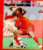
Flores registró 25 pases.

Además, el 'Orejas' está convencido de que la bicolor dará pelea a cualquier rival. "Somos una selección que nunca se ha rendido a pesar de las adversidades, así que vamos a levantar la cabeza e ir por nuestra re-