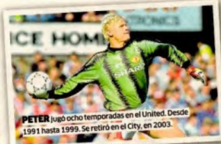
PETER jugó ocho temporadas en el United. Desde 1991 hasta 1999. Se retiró en el City, en 2003.

Pero el más famoso de sus 'viejos' es Peter Schmeichel. ¿Quién? El más grande portero