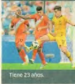
Tiene 23 años.

Pero 'Carta' no solo se quedó, sino que ayer tuvo minutos. Jugó 15', tocó la pelota cinco veces, dio cuatro pases, quitó un balón y cometió una falta. Para el siguiente proceso, seguramente, tendrá más tiempo en cancha. ■