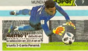
NUESTRO '1' debutó en la selección en 2014 en el triunfo 3-0 ante Panamá.

figuras y alcanzó el 66.7% de atajadas exitosas. La más impresionante la realizó a 5' del final, al evitar con el pecho la 'pepa' de Eriksen.