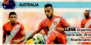
LLEVA 30 partidos con la 'sele', 28 con Ricardo Gareca.

de clubes de Europa. "Espero se concrete. Quiero salir de Flamengo, me siento incómodo", dijo el lateral izquierdo a la agencia EFE. Parece ser hora de dar el salto. ■