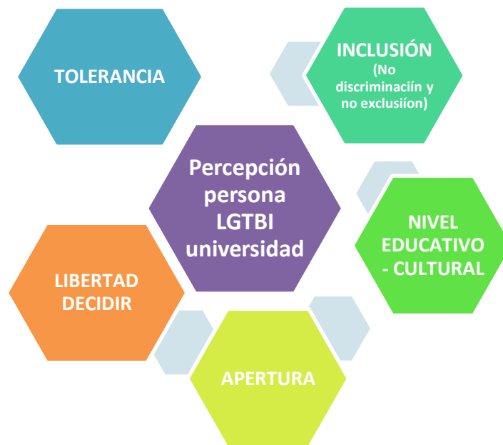
Figura 3: Tendencias y reacciones sobre la percepción persona LGTBI