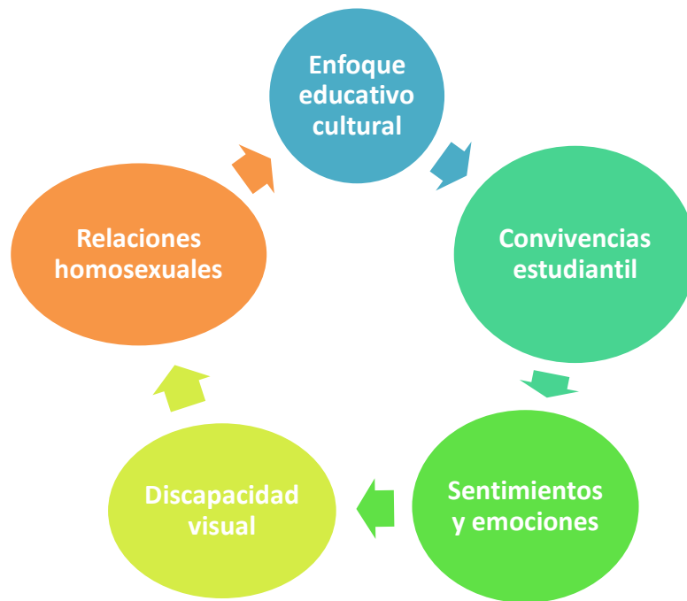
Figura 1: Argumentación narrativa desde el enfoque educativo – cultural