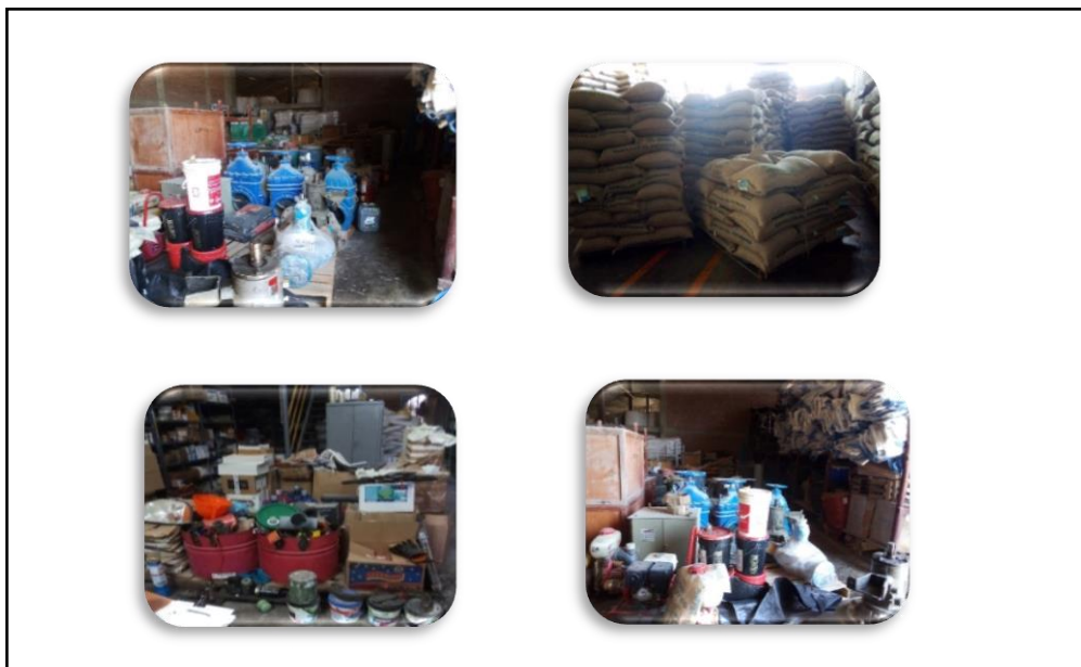
Figura 1: Almacenamiento

Análisis e interpretación de resultados: la información proporcionada muestra el almacenamiento en completo desorden, no existiendo una clasificación ni control de la mercadería.