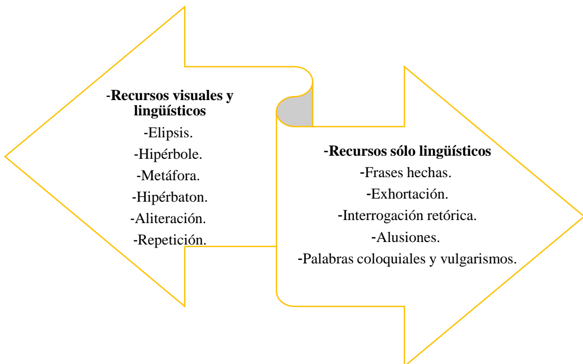
Figura 3. Aspectos sintácticos encontrados en el programa “El valor de la verdad”.