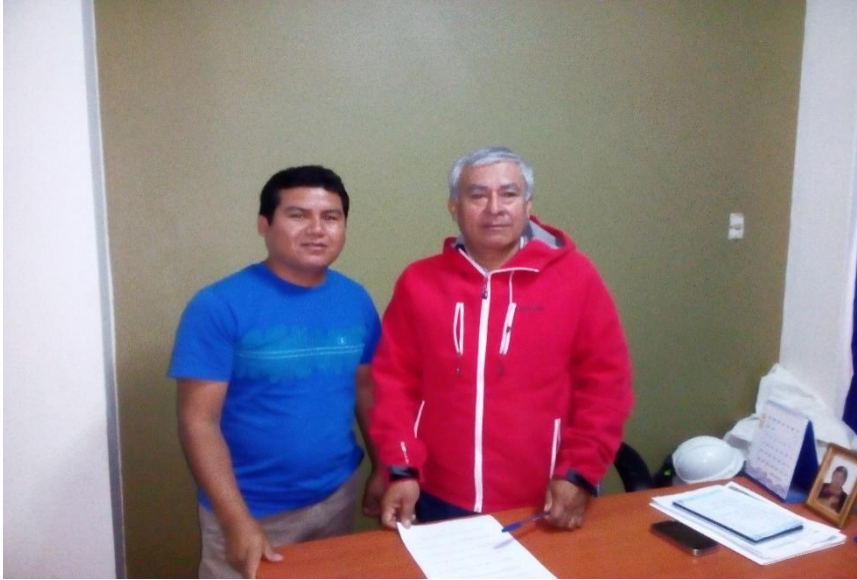
Figura 1. Entrevistando al gerente general.