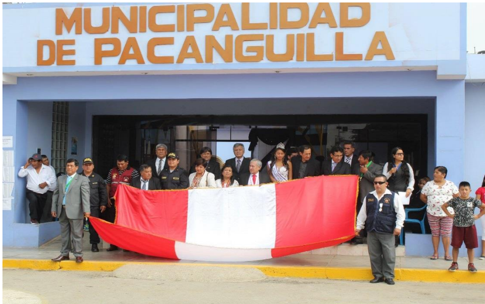
Figura 2. Municipalidad de Pacanguilla