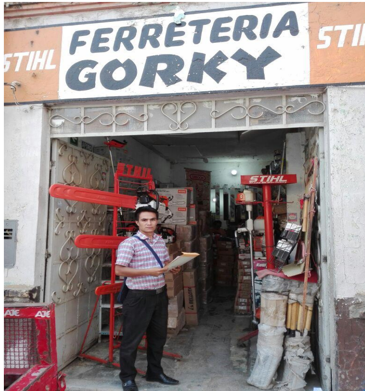
Frontis de la Empresa.