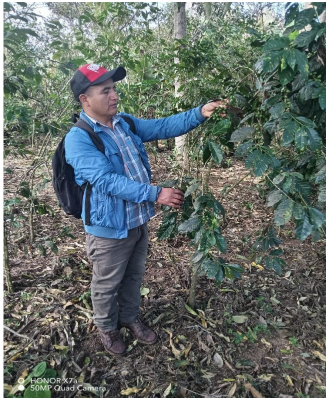
34 Fig. 2: Koya del cafeto: Hemileia vastatrix (A, B y C) en plantaciones de café de la variedad típico o nacional en el distrito de Huarmaca.