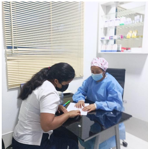
Figura 2. Explicación de la encuesta