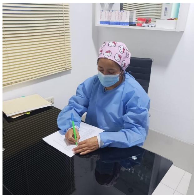
Figura 3. Llenado del cuestionario