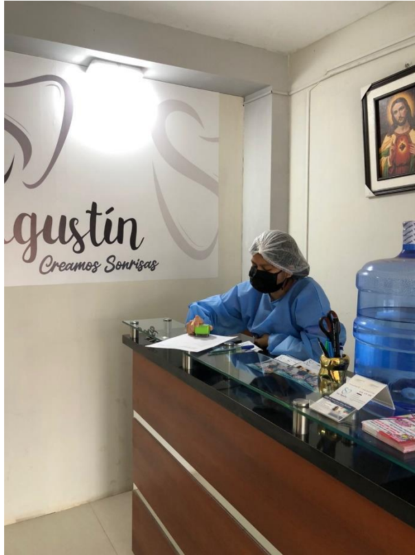
Figura 4. Firma del consentimiento informado