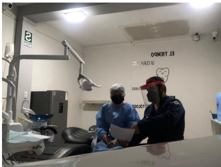
Figura 4. Explicación del cuestionario por el investigador