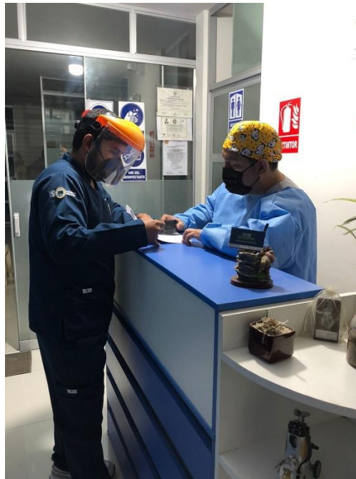
Figura 1. Firma del consentimiento informado