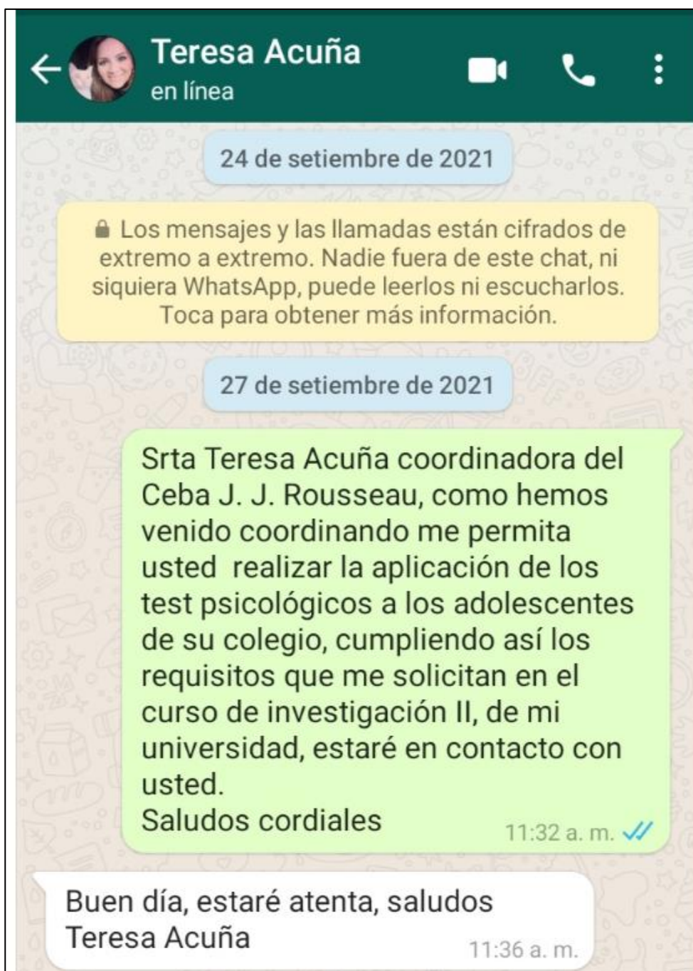
Figura 4. Comunicación con coordinadora del CEBA donde se ejecutó la investigación.