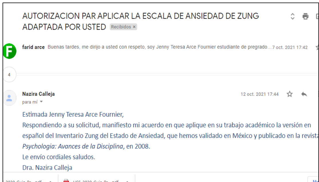
Figura 2. Autorización para utilizar la Escala de Autoevaluación de ansiedad de Zung (EAA)