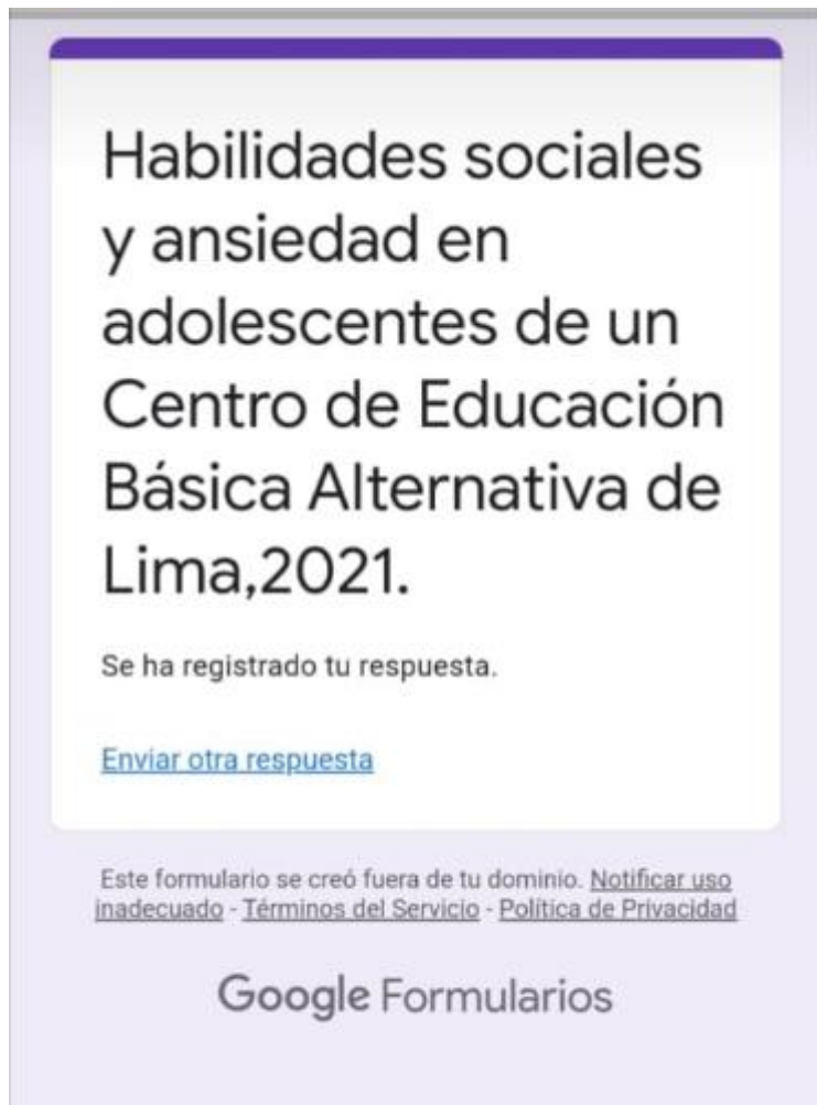
Figura 8. Evidencia de aplicación culminada de los instrumentos en Google Forms