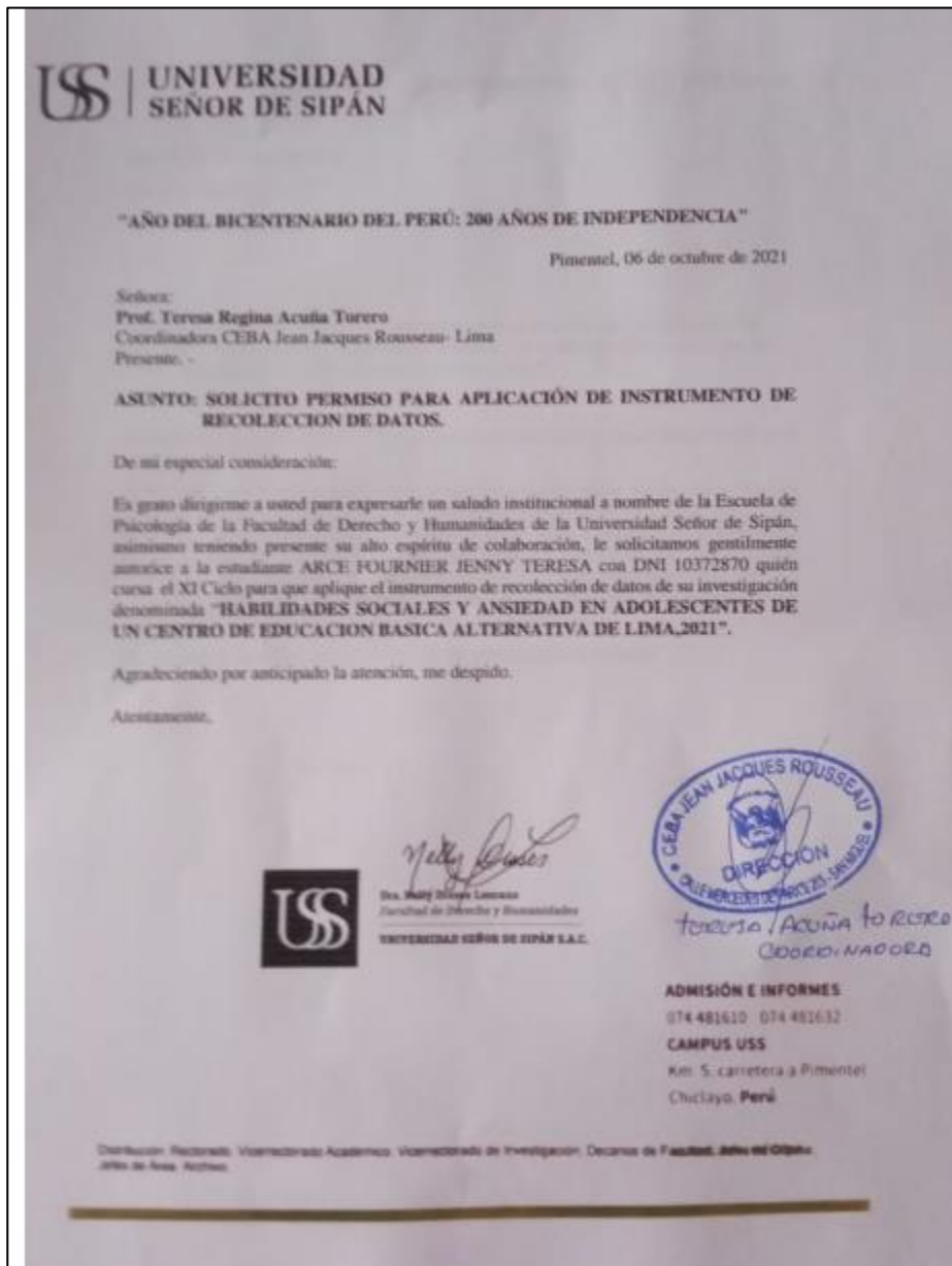
Figura 3. Carta de solicitud de permiso para ejecución de la investigación.