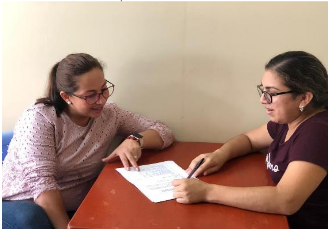
Aplicación de la encuesta