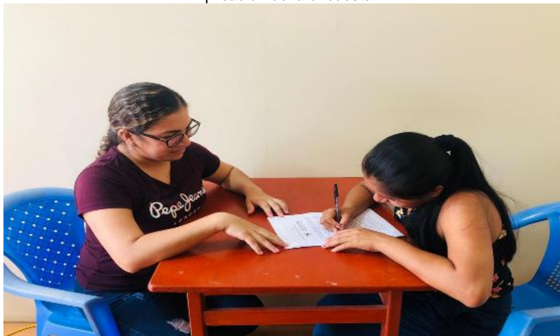
Aplicación de la encuesta