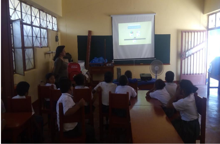
La docente utiliza recursos tecnológicos para promover hábitos de la lectura.