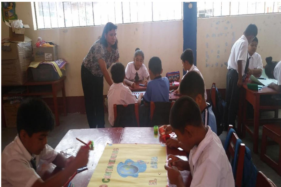
La docente utiliza estrategias didácticas mediante carteles para que los estudiantes comprendan el mensaje.