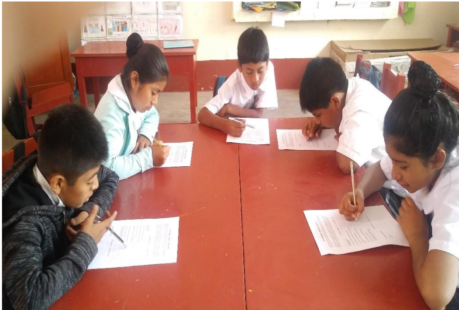
Actividades realizadas por los estudiantes para que comprendan lo que leen.