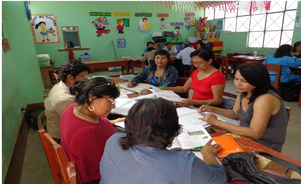
Talleres con docentes para realizar acciones reflexivas sobre hábitos de lectura.