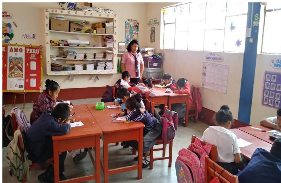
Los estudiantes cumplen con su hora de lectura en forma diaria acompañados de su docente.