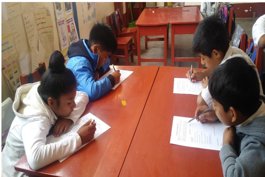
Estudiantes de quinto grado utilizan las primeras horas para leer en forma individual y luego grupal.