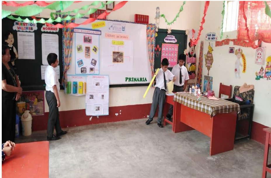
Estudiantes de quinto grado participando del Día del Logro en el área de Comunicación