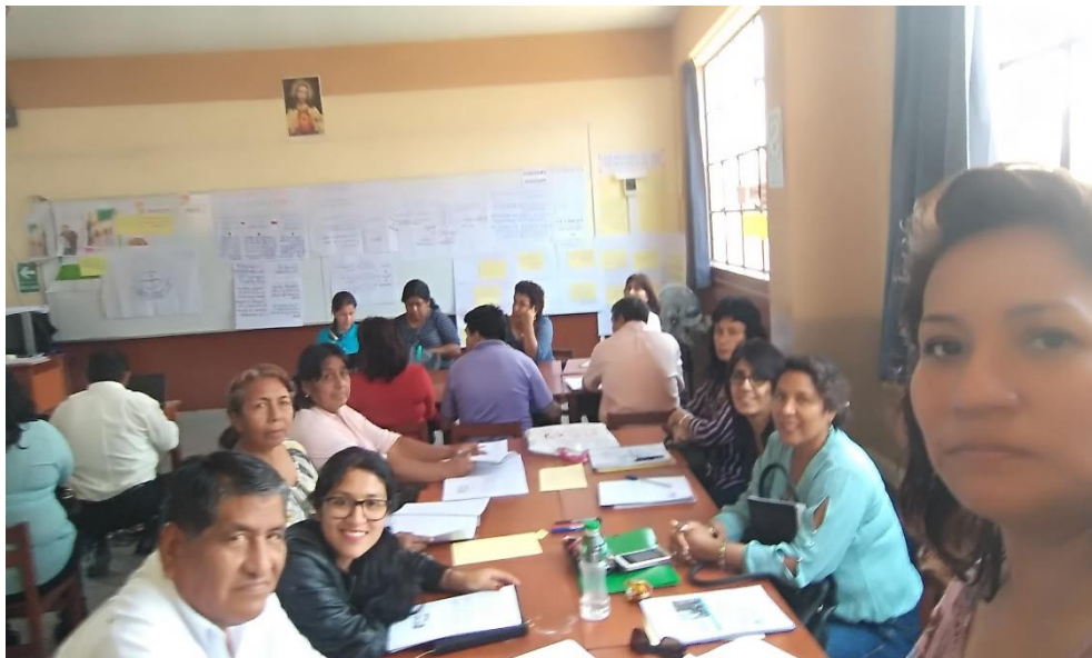
Reuniones de trabajos con el director y docentes para emplear estrategias didácticas en nuestras sesiones de aprendizaje.