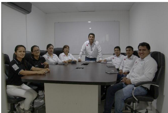
Ilustración 2: aplicación de instrumentos de recolección de datos, tanto como: entrevista y observación.