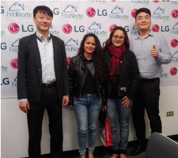
Ilustración 1: con los representantes de LG, proveedores potenciales de la empresa.