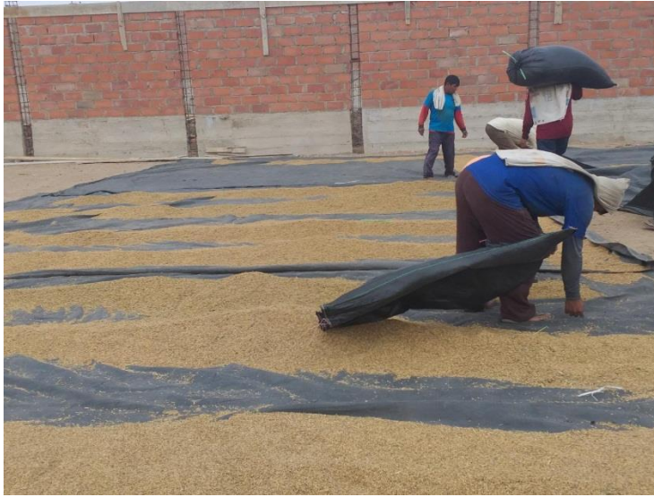
Figura 1 Exteriores de las instalaciones