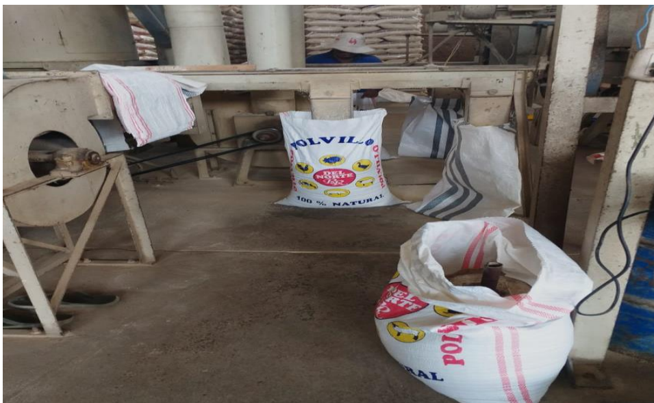
Figura 4 Instalaciones del molino. Espacio de subproductos.