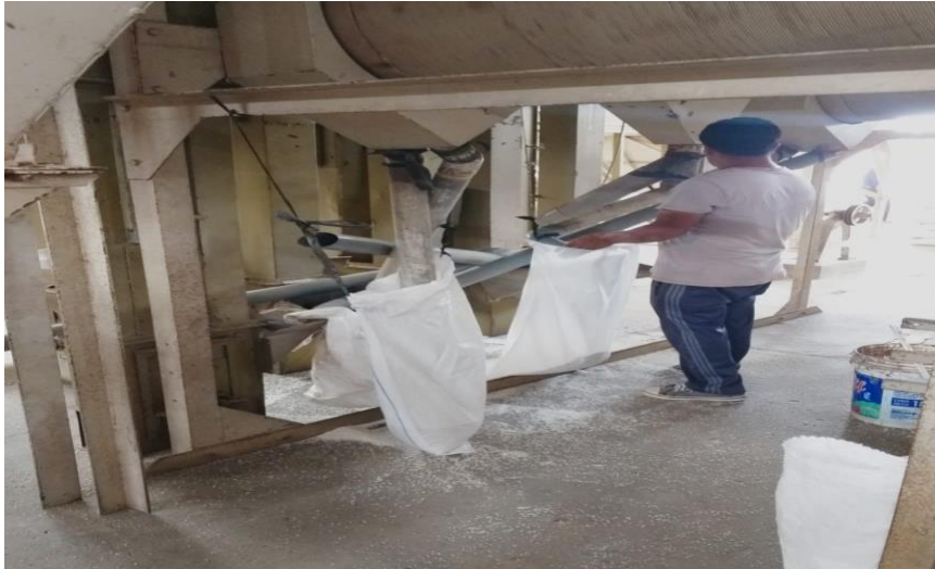
Figura 2 Instalaciones del