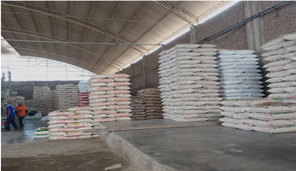
Figura 5 Almacén de productos de la empresa