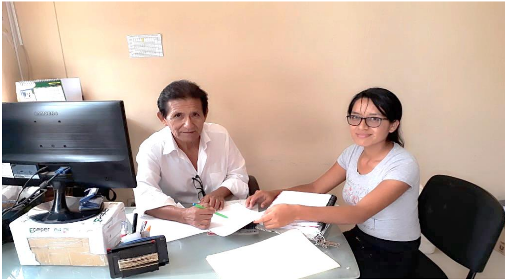
Figura 1. Entrevista con el contador de la empresa Gasocentro Sican SAC