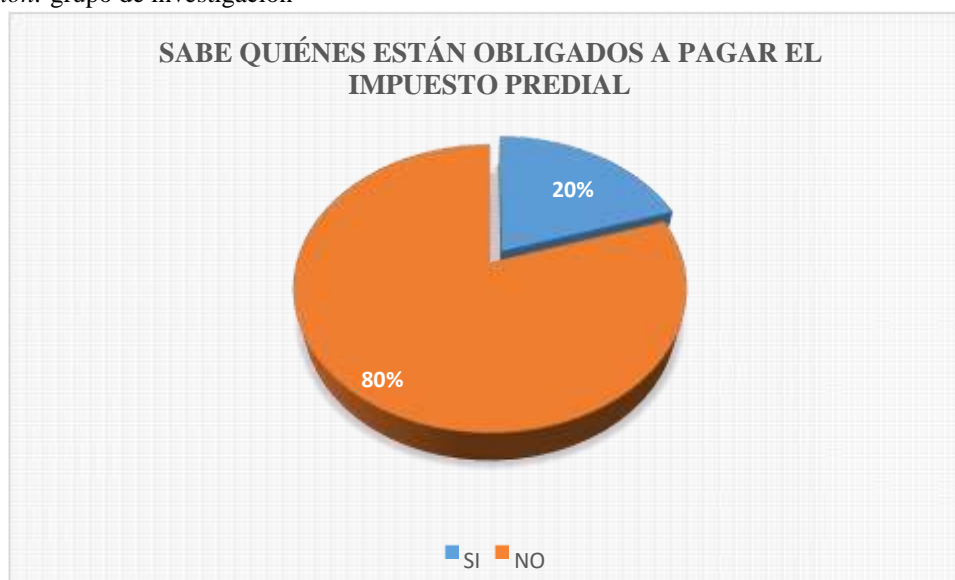
Figura 8: Es el resultado de la tabla 8.

Fuente: encuesta a los pobladores de la ciudad de Cutervo.