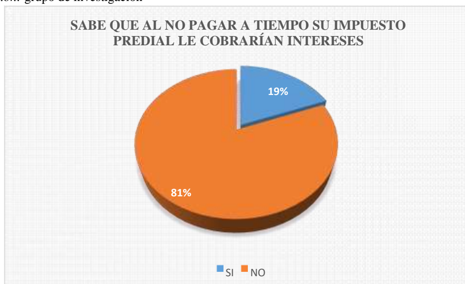
Figura 6. Es el resultado de la tabla 6.