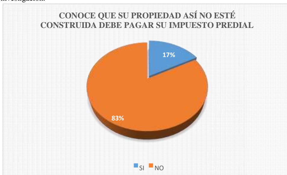
Figura 10: Es el resultado de la tabla 10.

Fuente: encuesta realizada a los ciudadanos de la ciudad de Cutervo. Elaboración: grupo de investigación.