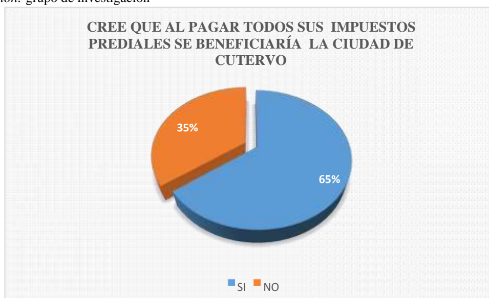
Figura 5: Es el resultado de la tabla 5.