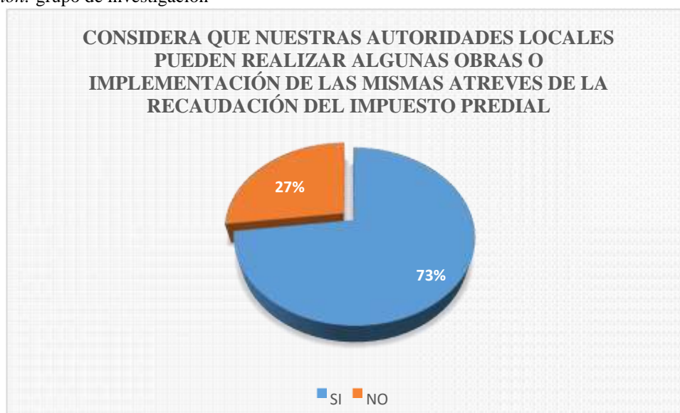
Figura 7: Es el resultado de la tabla 7.