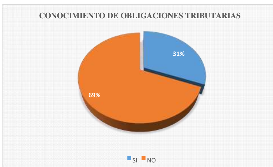
Figura 1: Es el resultado de la tabla 1.

Fuente: encuesta realizada a los ciudadanos de la ciudad de Cutervo. Elaboración: grupo de investigación.