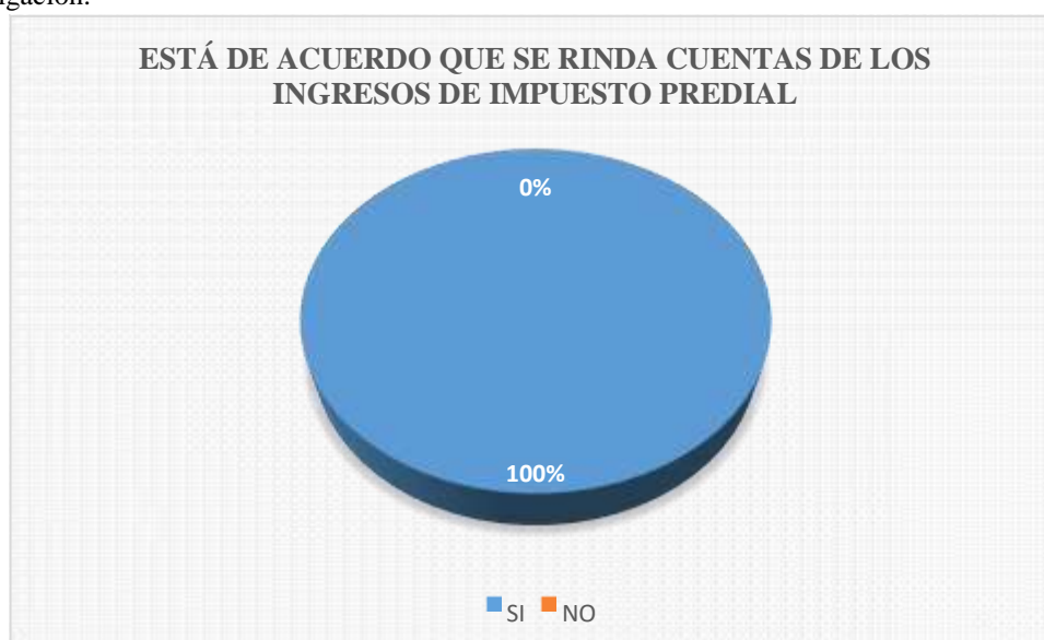
Figura 14: Es el resultado de la tabla 14.