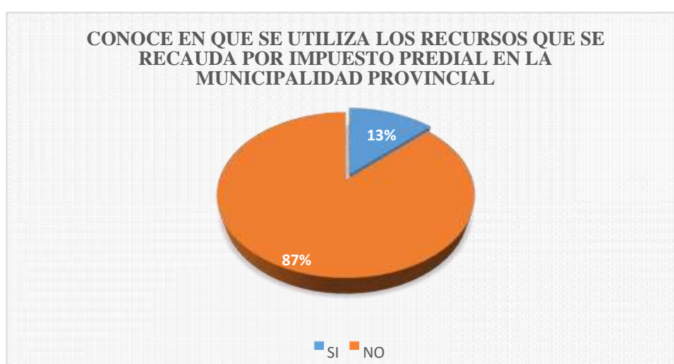
Figura 3: Es el resultado de la tabla 3.