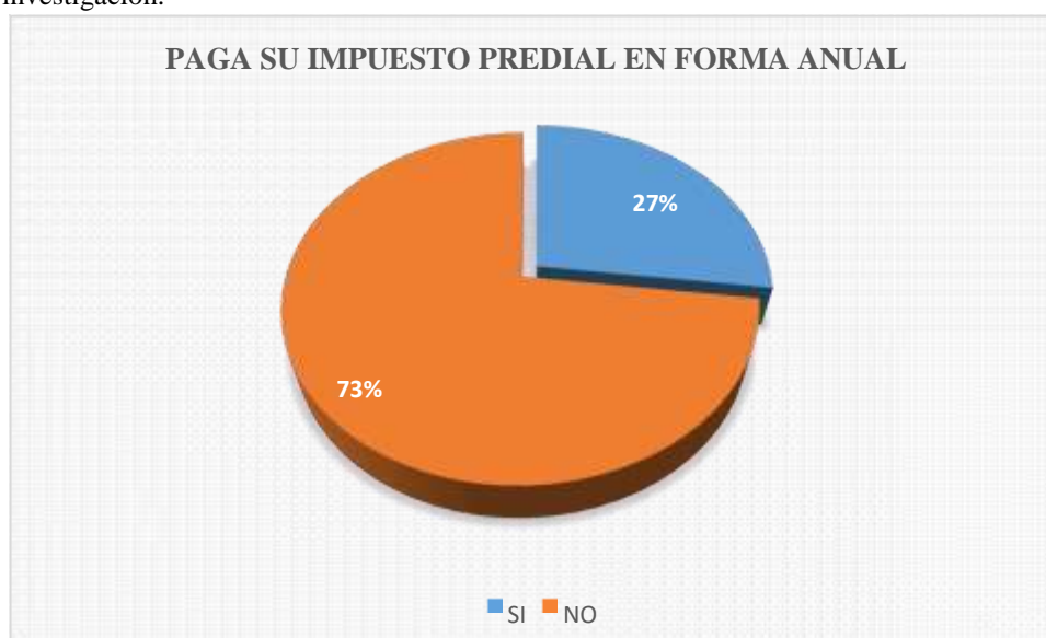
Figura 4: Es el resultado de la tabla 4.