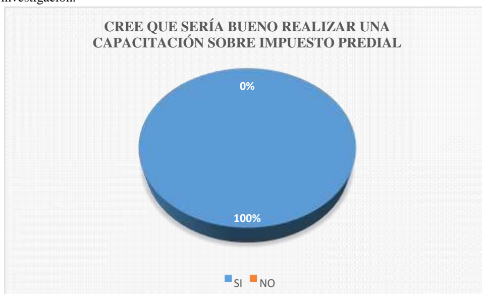
Figura 12: Es el resultado de la tabla 12.