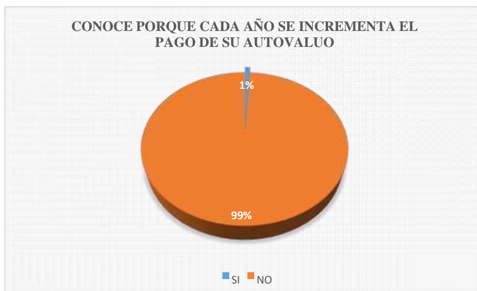
Figura 13: Es el resultado de la tabla 13.