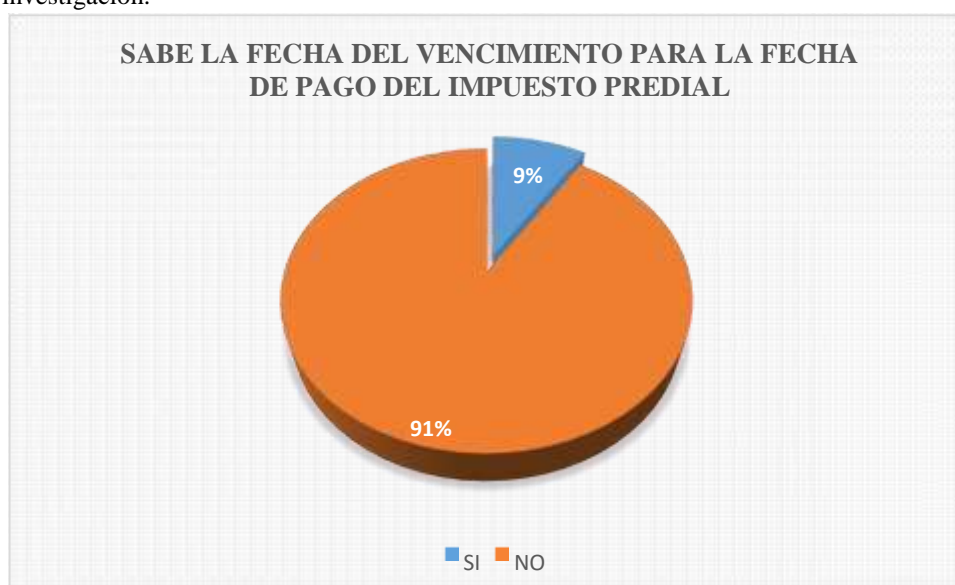
Figura 9: Es el resultado de la tabla 9.