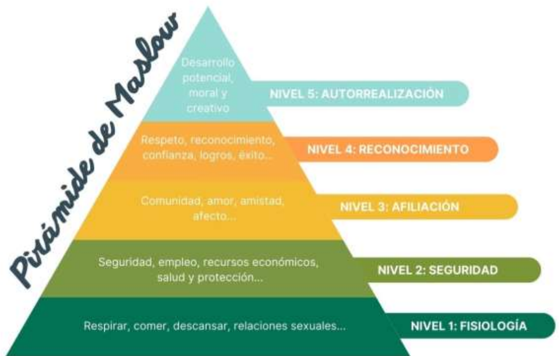
Figura 1 Pirámide de Maslow